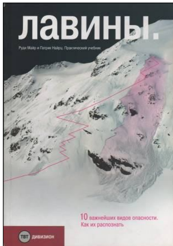
Книга «Лавины» Руди Майра и Патрика Найрца